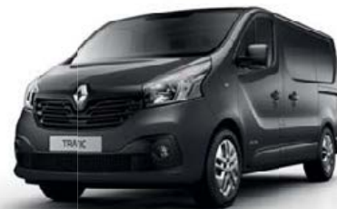
Gris Taupe (OV KPF)*