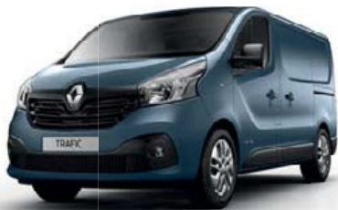
Bleu Panorama (TE J43)**