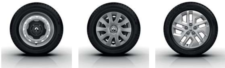
Enjoliveur 16" Mini