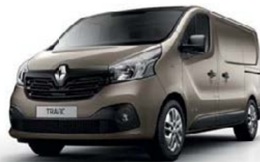
Beige Cendré (TE HNK)**

* Peinture opaque. ** Peinture métallisée. (1) H1/H2 Photos non contractuelles.