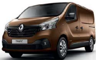
Brun Cuivre (TE CNH)**