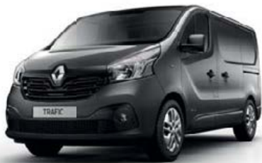
Gris Cassiopée (TE KNG)**