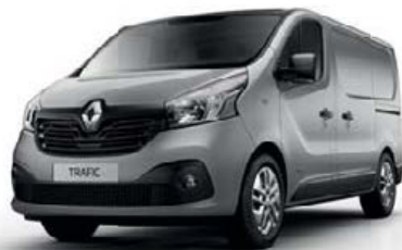
Gris Platine (TE D69)**