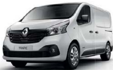
Blanc Glacier (OV 369)*