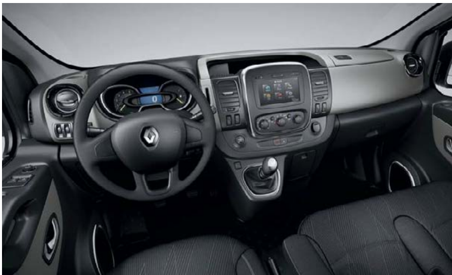
Visuel présenté avec les options Média Nav Evolution et Carte mains-libres