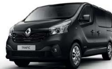
Noir Crépuscule (TE D68)**