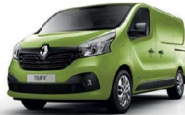
Vert Bambou (OV DPA / O DPL)* (1)