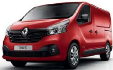
Rouge Magma (OV NNS / O C70)* (1)